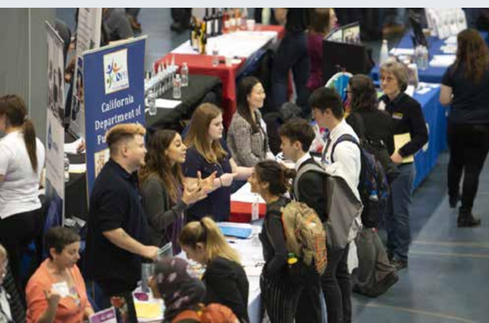
Las ferias de carreras profesionales de UC Davis ofrecen una gran oportunidad para conocer a posibles empleadores.

Creo que hablo en nombre de cientos de colegas cuando digo lo emocionada que estoy al dar la bienvenida a sus alumnos al campus este otoño. Espero con enorme interés volver a relacionarme en persona, ¡de manera segura, por supuesto!, para ayudar a que las familias de UC Davis tengan la mejor experiencia universitaria.